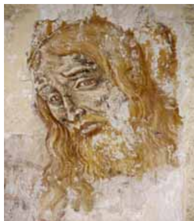
Brando, oratoire de la confrérie Santa Croce. Traces de décors partiellement dégagés.