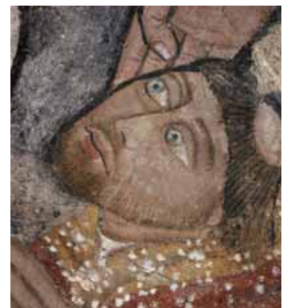
Valle di Campoloro, chapelle Sainte Christine. Décor de 1473 : le donateur, détail.