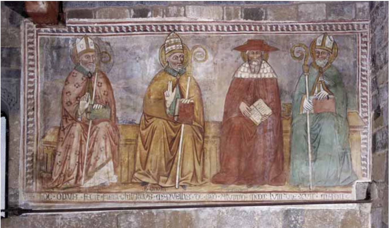
Aregno, chapelle de la Trinité. Les Quatre Docteurs de l'Église : Saint Augustin, Saint Grégoire, Saint Jérôme, Saint Ambroise.