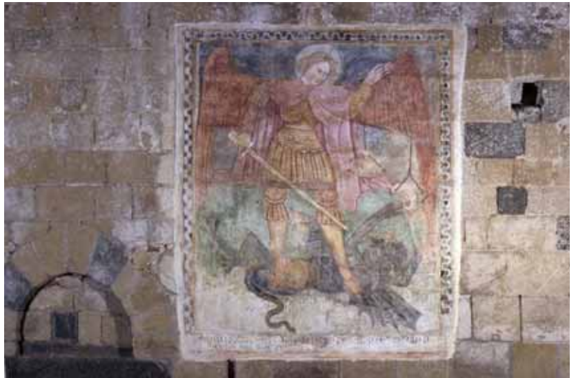
Aregno, chapelle de la Trinité. Saint Michel Archange