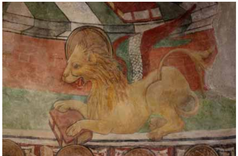
Gavignano, chapelle Saint Pantaléon. Le lion de Saint Marc .