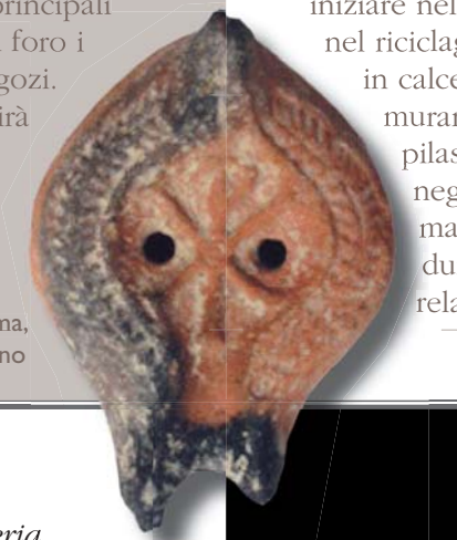
Lampada ad olio decorata con il crisma, simbolo protocristiano

Come Mariana, un'altra città situata più a nord, la romana Aleria viene edificata durante il primo secolo a. C. Le vestigia oggi visibili corrispondono al centro della città romana, il cui popolamento è avvenuto mediante una colonizzazione in tre ondate attribuite rispettivamente a Silla, verso l'81 a. C., a Cesare nel 46 a. C. e ad Ottaviano attorno al 32 a. C. I principali monumenti della città si situano intorno ad un foro i cui lati porticati costituivano la facciata dei negozi. La città evolverà fino alla tarda antichità e subirà numerose modifiche ed interventi visibili sugli edifici o nella disposizione generale degli assi viari urbani.