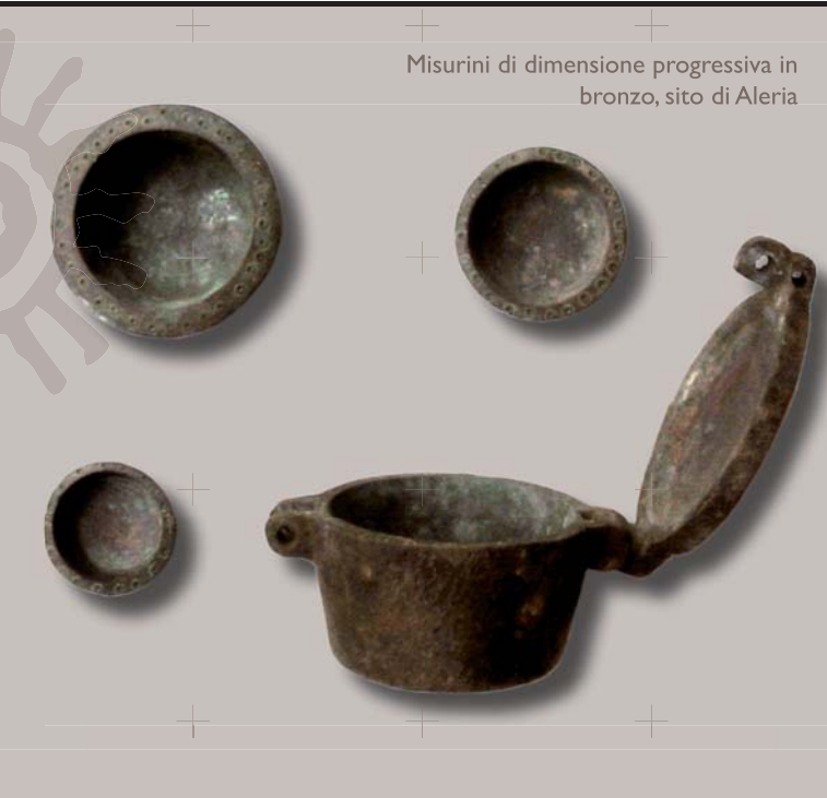
Misurini di dimensione progressiva in bronzo, sito di Aleria