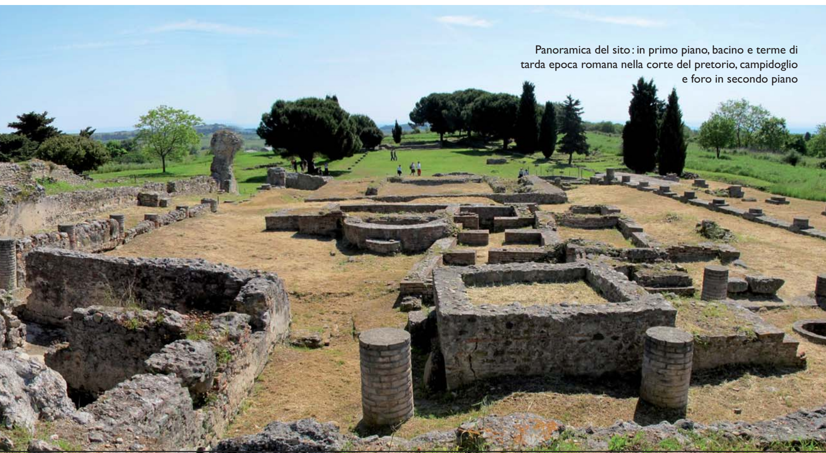
Panoramica del sito: in primo piano, bacino e terme di tarda epoca romana nella corte del pretorio, campidoglio e foro in secondo piano