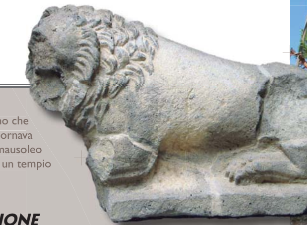
Leone preromano che probabilmente ornava l'ingresso di un mausoleo o di un tempio

Nel V° secolo a. C. lo storico Erodoto cita l'arrivo da oriente di un gruppo di Greci, cacciati dai persiani verso il 545 a. C., quando una colonia greca occupava già da venti anni Alalié. Oggi solo alcuni frammenti di ceramica a figure nere scoperti nel sito ricordano l'insediamento greco evocato da questo testo. La necropoli di Casabianda, situata a sud, rivela arredi funerari dei secoli V° e IV° a. C., costituiti soprattutto da vasi etruschi e greci. Le loro particolarità lasciano supporre l'esistenza di rapporti stretti con il nord dell'Etruria, la cui natura resta tuttavia ancora da definire.