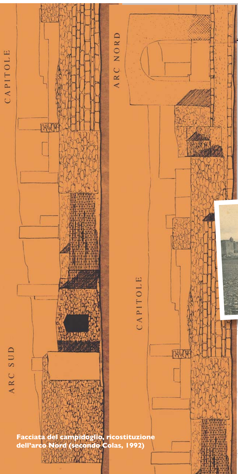
Facciata del campidoglio, ricostituzione dell'arco Nord (secondo Colas, 1992)