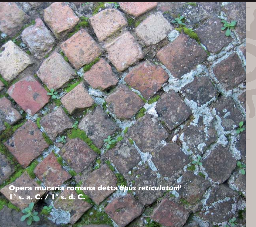
Opera muraria romana detta "opus reticulatum" 1° s. a. C. / 1° s. d. C.