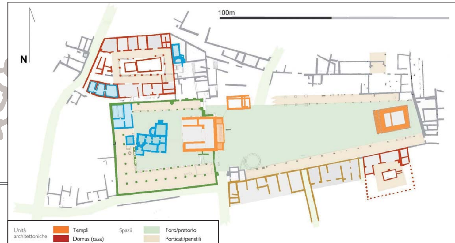
Pianta del quartiere centrale di Aleria Antica

Le città antiche di Aleria e Mariana costituiscono le due maggiori agglomerazioni romane conosciute nell'isola. La loro rispettiva edificazione sembra strettamente legata alla presenza di importanti fiumi e di vaste distese di terreno coltivabile. Oltre ad essere stata l'epicentro economico della bassa valle del Tavignano, Aleria è stata anche una città di guarnigione ospitante in particolare un distaccamento della flotta di Miseno.