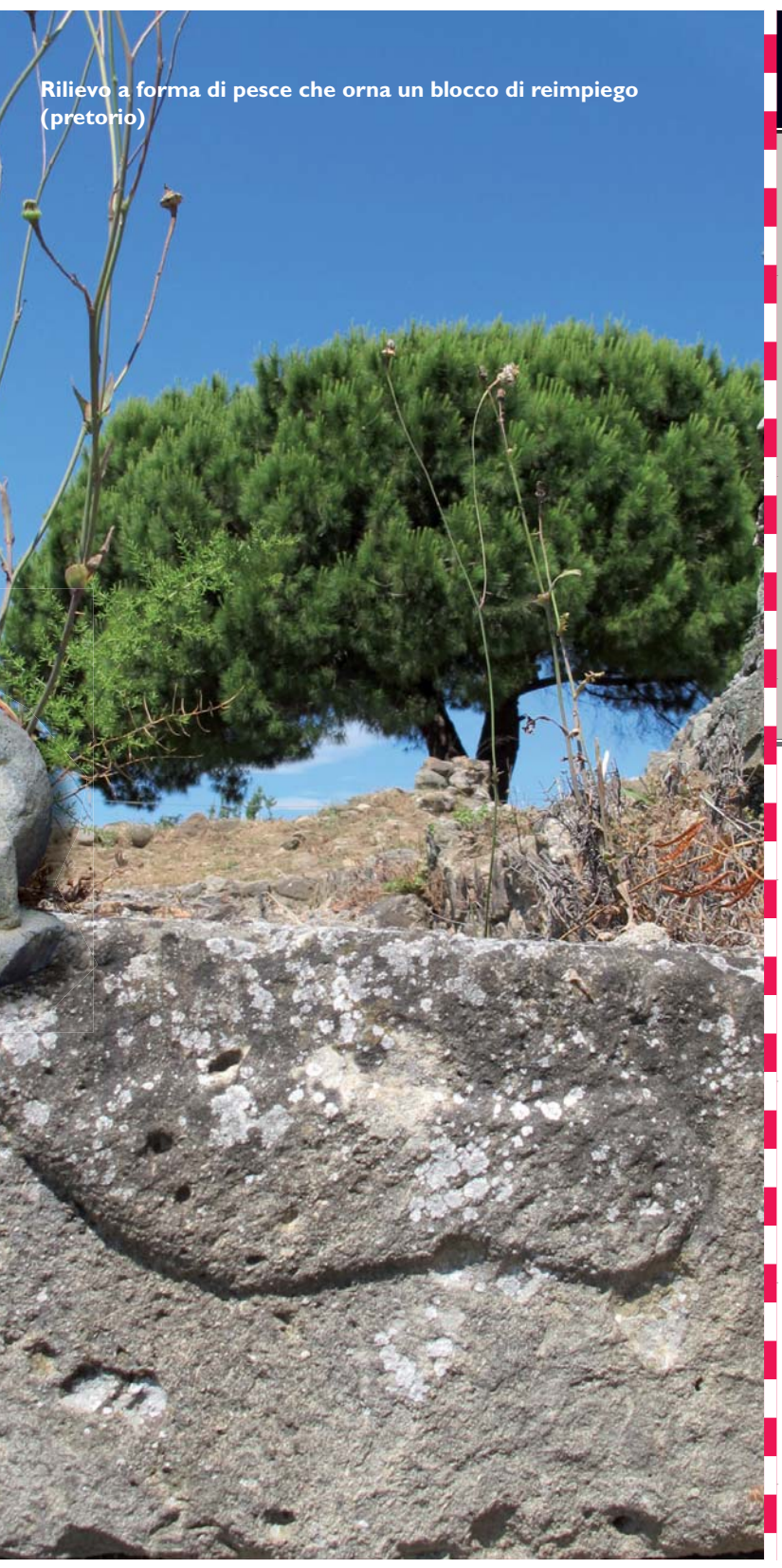
Rilievo a forma di pesce che orna un blocco di reimpiego (pretorio)

À u Vu s. nanzu à Cristu u storicu Erudotu mintuveghja l'arrivu d'un gruppu di grecchi d'orientu persecutati da i Persi ver di 545 n. à C., cbi tandu una culunia greca era aghjā stabilita in Alalié dapoì 20 anni. Oghje solu uni pochi di chjappuli di ceramica faciata nera scuparti nantu à u situ ramentanu a prisenza greca evucata da issu testu. A necropoli di Casabianda, più sottu, palesa una mubiglia funerale di i Vu è IVu seculi n. à C, cumposta frà altri di vasetti etruschi è grecchi. E so particolarità lascianu pinsà ch'ella ci fù cù l'Etruria di u nordu una rilazione forte cbi a so natura ferma à schjarisce.