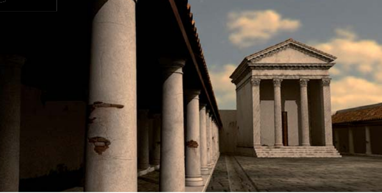
Immagine di sintesi Vista verso est, portico nord e tempio

Si tratta di reimpiecu d'elementi archititturali sia da fā a calcina, sia aduprati tale è quale da i muratori. Tistimuniughjanu in negativu di isse fatture i pilastri di l'arcu uccidentale cbi si vedenu i stampi di i blocchi di paramentu cavati. Pare ch'ella sia durata issa pratica sinu à u XIXu s., ciò cbi pudaria spicà a rilativa scarsessa di u marmaru nantu à u situ.