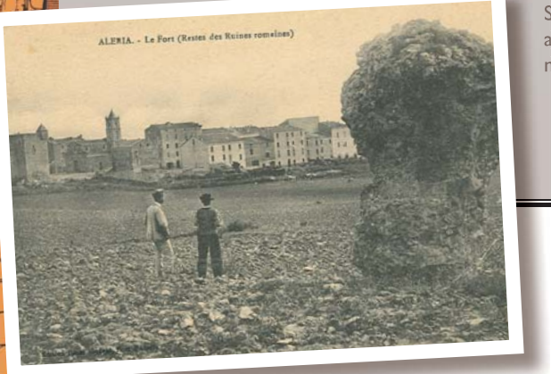
Sito d'Aléria intorno al 1900, resto dell'arco nord

Le rovine della città antica di Aleria sono descritte per la prima volta da Prosper Mérimée (1803-1870) dopo il suo viaggio come ispettore in Corsica nel 1839. Cita in particolare l'arco occidentale e le fasce di livellamento della costruzione rettangolare laterale. Tra il 1955 ed il 1960 Jean Jehasse intraprende i primi scavi importanti. Questo periodo è segnato dalla scoperta del Foro (la piazza pubblica) e di una grande parte dell'insediamento romano attualmente visibile. Scoperta a circa 1000 metri a sud dal sito antico, la necropoli preromana viene scavata tra il 1960 ed il 1981. Molti oggetti provenienti da questo scavo sono visibili nel museo dipartimentale Jérôme Carcopino, situato in prossimità del sito antico.