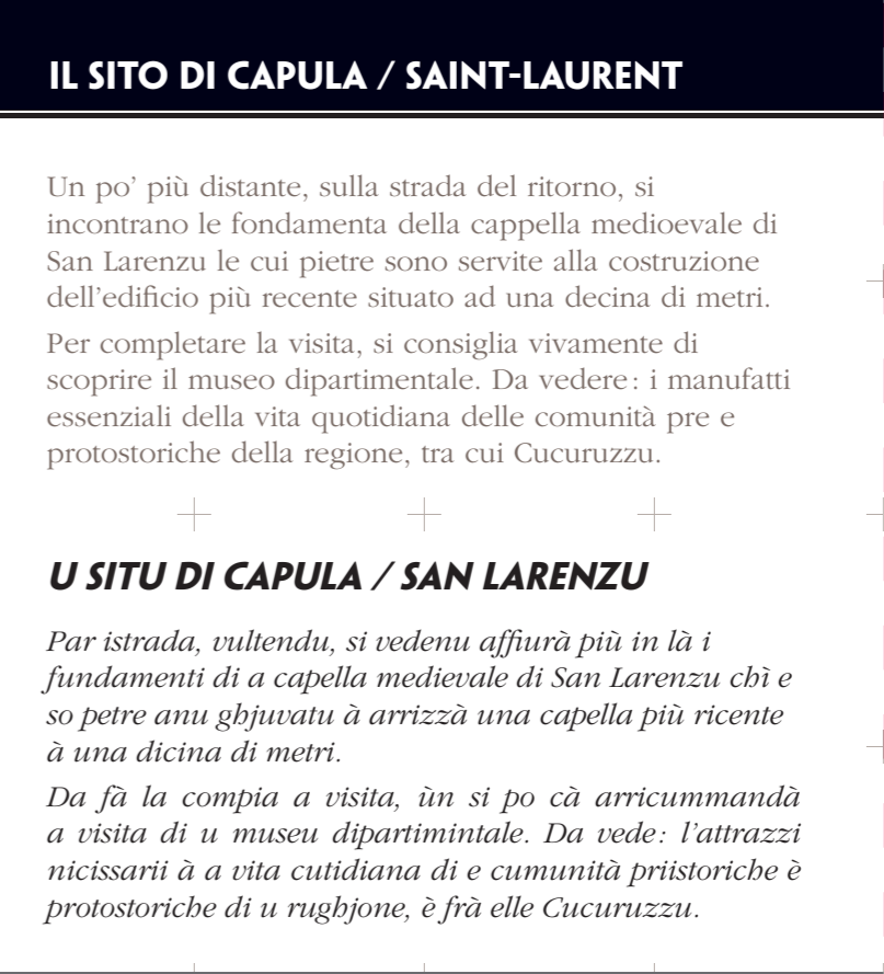
Cappella San Lorenzo (XX° secolo)

À u nordeste di u munimentu supraneghja a Torre, una torra d'ottu metri di diamitru chì ne ferma trà 4 à 5 m d'altezza. In quelli tempi ci sarà statu un pianu cù un curridore affiancatu di diverticuli è una pezza maestra. Òn si sà ancu da veru à ciò ch'ella ghjuvava. Si pò tene l'ipotesi d'un locu da allucà è da trasfurma a manghjusca. Una parte di a cupatura fatta à tighjone acconcie in falsa curnice hè stata prisirvata. Issu gennaru di custruzzione s'assumiglia à l'architettura di u mediterraniu di quelli tempi, in particolare i nuraghi sardi.