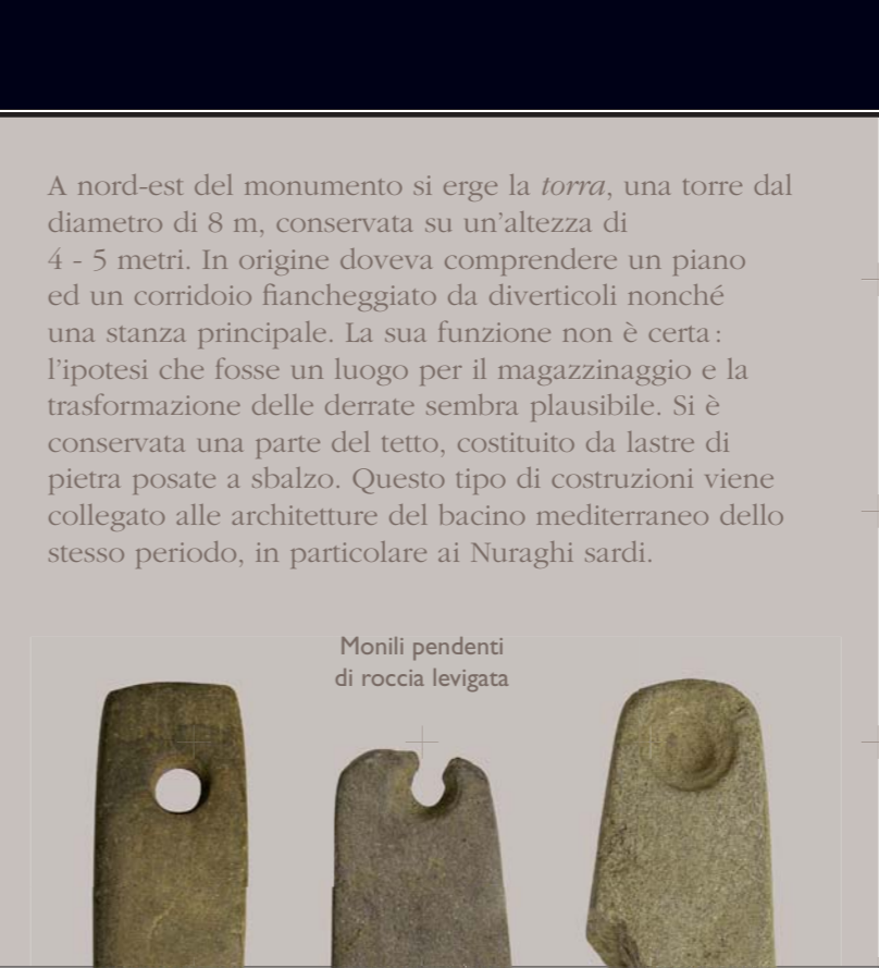
Monili pendenti di roccia levigata

À u nordeste di u munimentu supraneghja a Torre, una torra d'ottu metri di diamitru chì ne ferma trà 4 à 5 m d'altezza. In quelli tempi ci sarà statu un pianu cù un curridore affiancatu di diverticuli è una pezza maestra. Òn si sà ancu da veru à ciò ch'ella ghjuvava. Si pò tene l'ipotesi d'un locu da allucà è da trasfurma a manghjusca. Una parte di a cupatura fatta à tighjone acconcie in falsa curnice hè stata prisirvata. Issu gennaru di custruzzione s'assumiglia à l'architettura di u mediterraniu di quelli tempi, in particolare i nuraghi sardi.