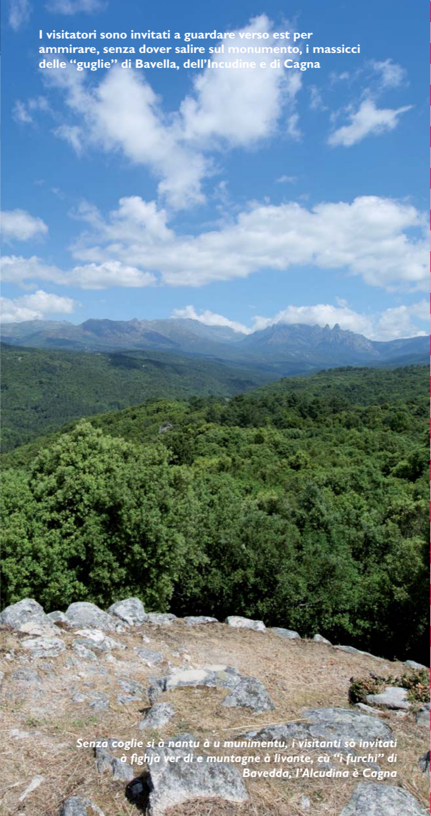
I visitatori sono invitati a guardare verso est per ammirare, senza dover salire sul monumento, i massicci delle "guglie" di Bavella, dell'Incudine e di Cagna

Pà a spaccatura d'un pitronculu di granitu massiciu, l'accessu à u casteddu: hè intundatu da un accintu fattu di muraglioni megalitichi curvi alti di 5 metri è larghi di 3. Loghje chì avaranu ghjuvatu à e faccende d'ogni ghjornu (pignule, tissitura, macellu...) ci sò state assistate. À manca di l'intrata, firmava tarraglie è resti di biada inde uni pochi di ritiri chì ci avaranu allucatu a robba.