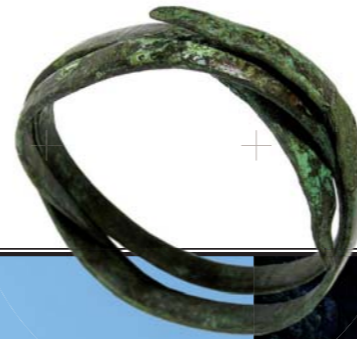
Braccialetto in bronzo, da scoprire al museo dell'Alta Rocca

Per la vostra sicurezza ed il rispetto del sito è vietato salire sui muri di cinta e sulla torre