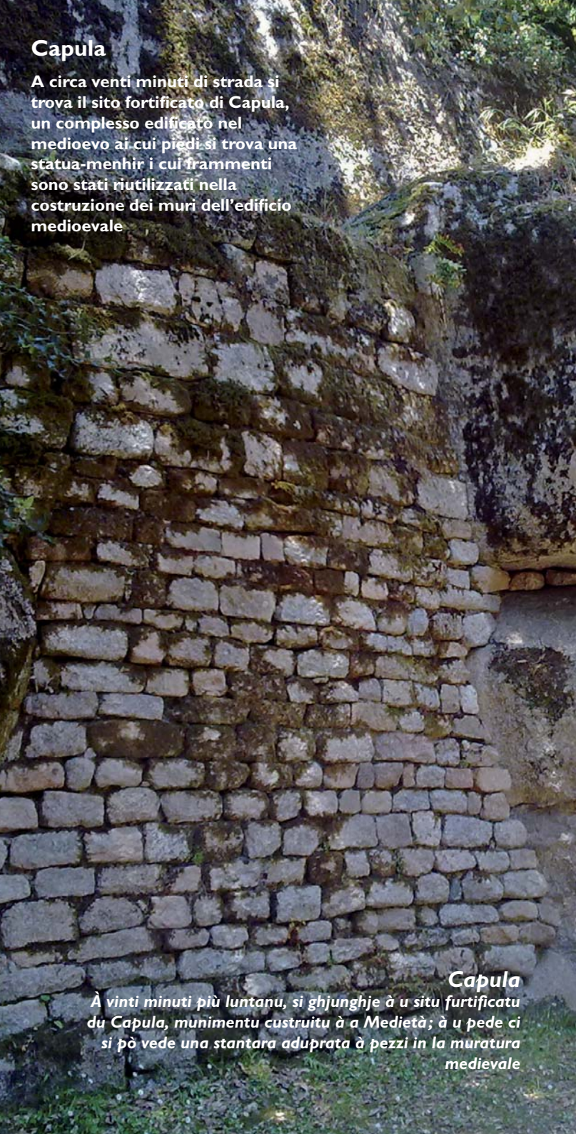
Capula A venti minuti più lontana, si ghjunghje à u situ fortificatu di Capula, munimentu custruitu à a Medietà; à u pede ci si pò vede una stantara aduprata à pezzi in la muratura medioevale

A circa venti minuti di strada si trova il sito fortificato di Capula, un complesso edificato nel medioevo ai cui piedi si trova una statua-menhir i cui frammenti sono stati riutilizzati nella costruzione dei muri dell'edificio medioevale.