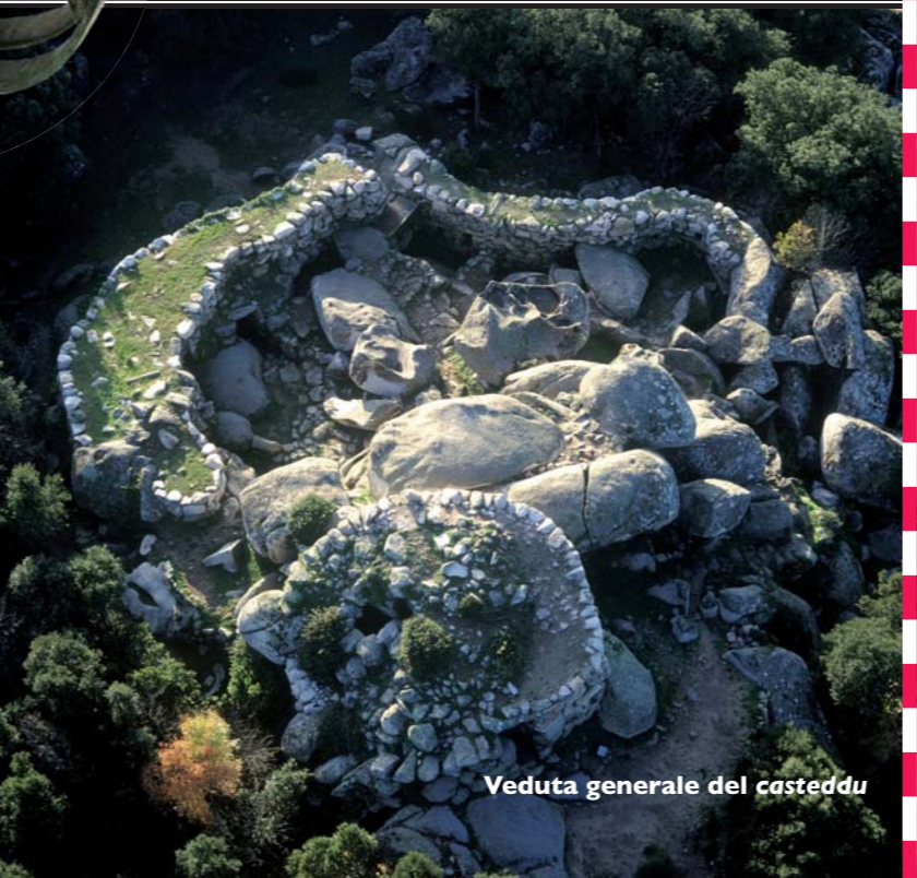
Veduta generale del casteddu