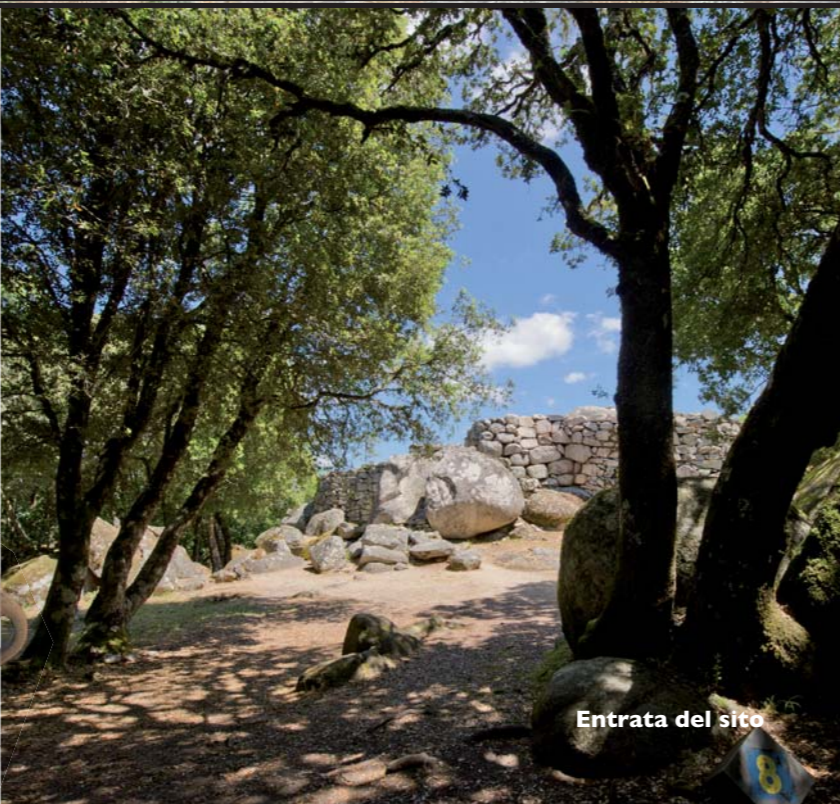
Entrata del sito