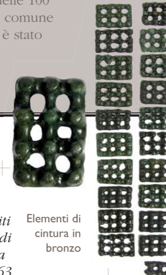
Elementi di cintura in bronzo