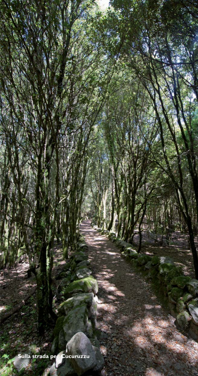
Sulla strada per Cucuruzzu