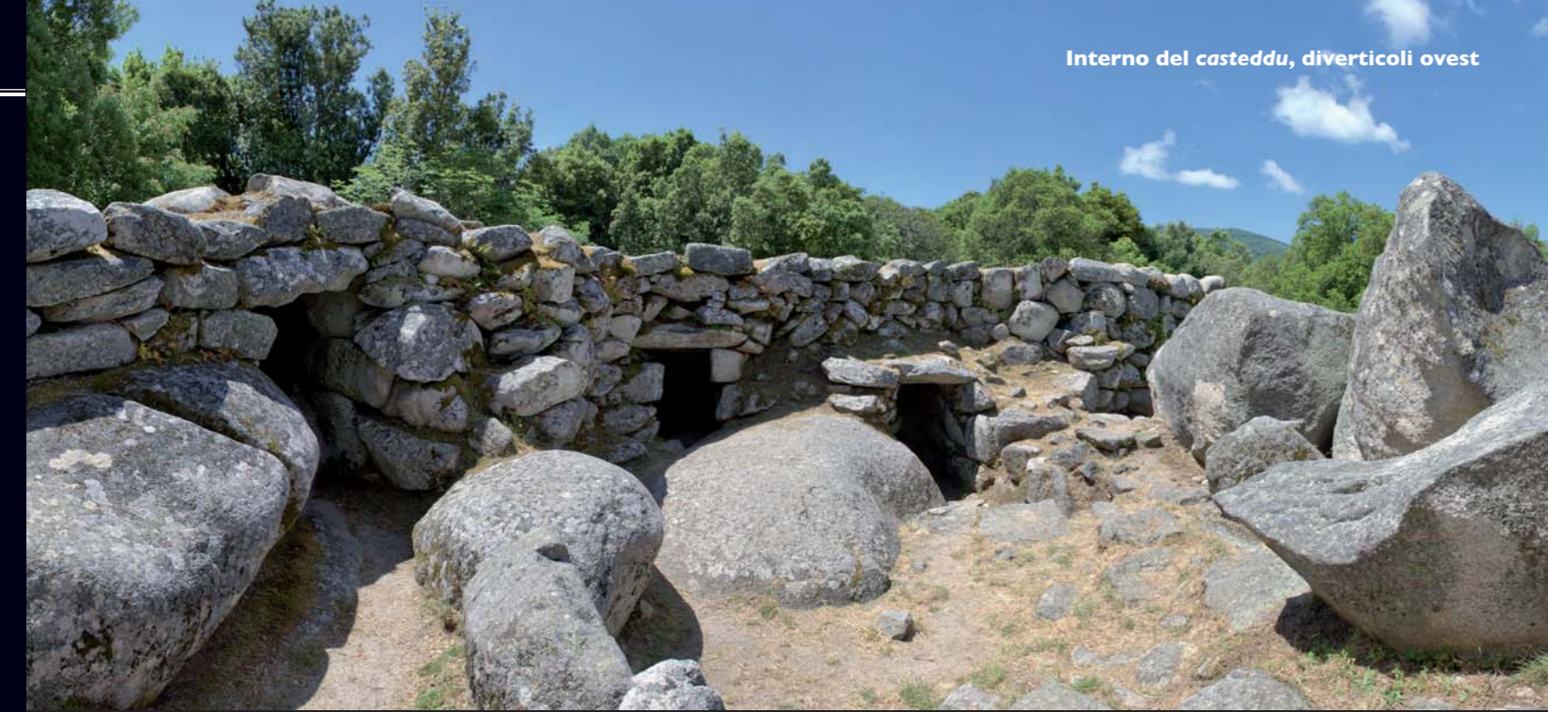
Interno del casteddu, diverticoli ovest