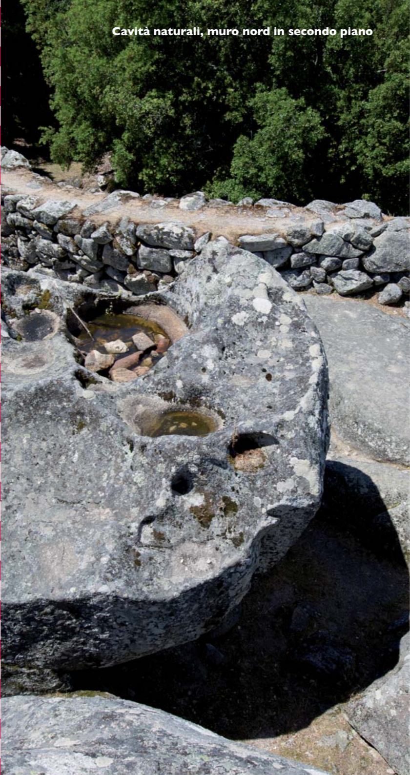
Cavità naturali, muro nord in secondo piano