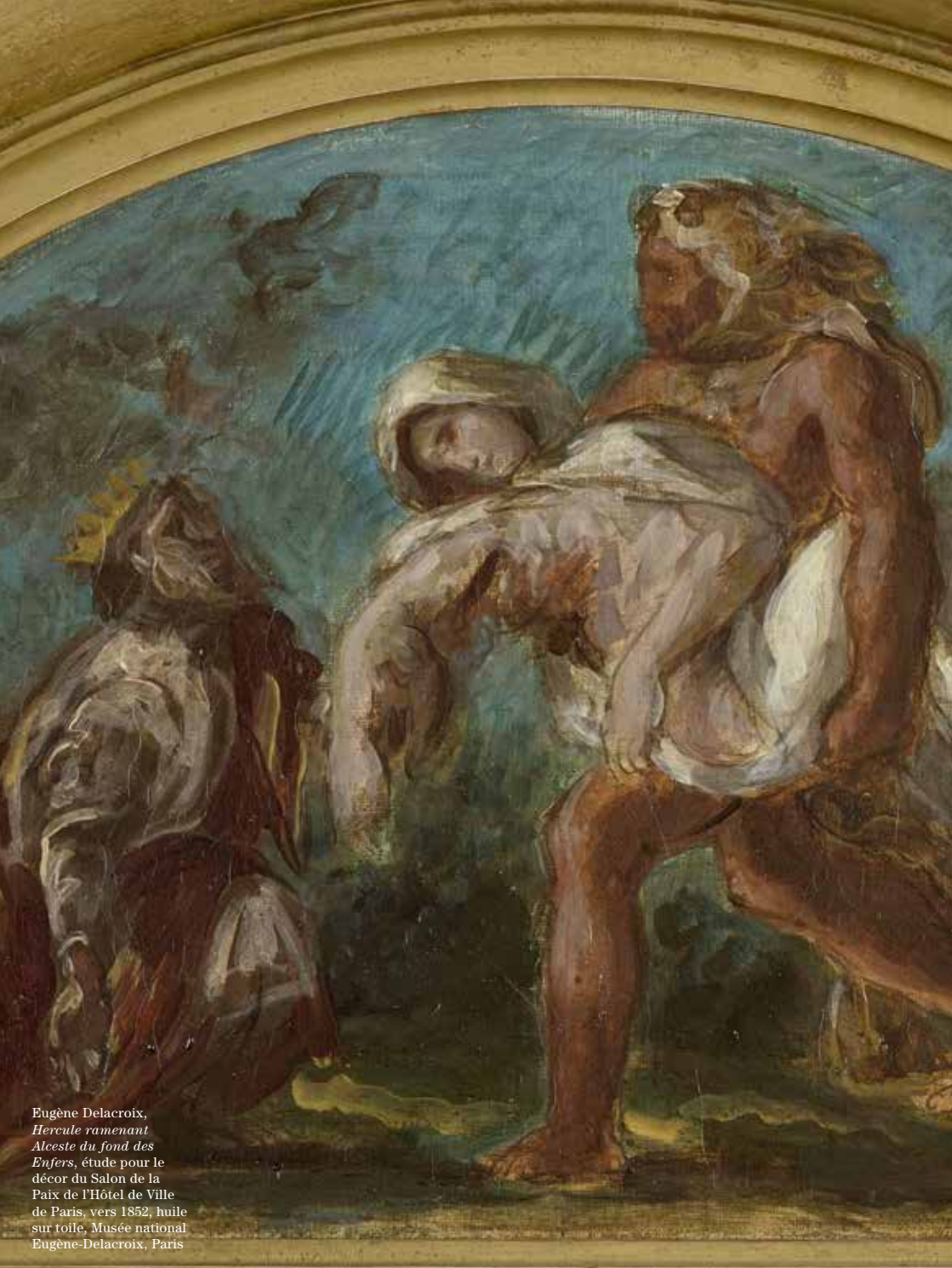
Eugène Delacroix, Hercule ramenant Alceste du fond des Enfers , étude pour le décor du Salon de la Paix de l'Hôtel de Ville de Paris, vers 1852, huile sur toile, Musée national Eugène-Delacroix, Paris