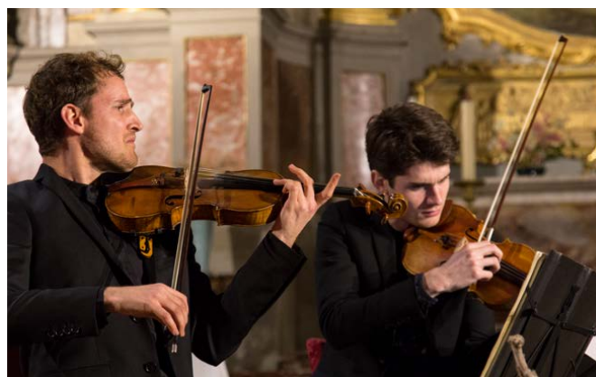
Quatuor Agate - Février 2018, Toulouse