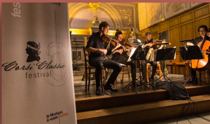
CorsiClassic édition 2017 Église d'Afa