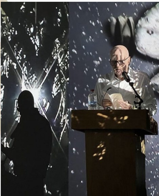
"Lecture de L'instant précis où Monet entre dans l'atelier par Jean-Philippe Toussaint au Musée des Impressionnismes, dans le cadre de l'exposition Au film du temps de Ange Leccia."