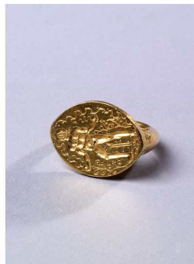
03. Bague-sceau Or coulé, ciselé 320-275 av. J.-C. (vers) Nécropole d'Aleria-Casabianda - Tombe 33 Musée d'Aleria- MAA.2018.0.371