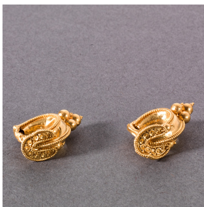
05. Paire de boucles d'oreille « a grappolo » étrusques Tôle d'or IV e siècle av. J.-C. Nécropole d'Aleria-Casabianda - Tombe 148 Musée d'Aleria- MAA.2018.0.4527