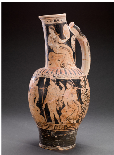
02. Peintre de la Villa Giulia Oenochoe étrusque Céramique à figures rouges 350-320 av. J.-C. (vers) Nécropole d'Aleria-Casabianda - Tombe 63 Musée d'Aleria- MAA.2018.0.1106