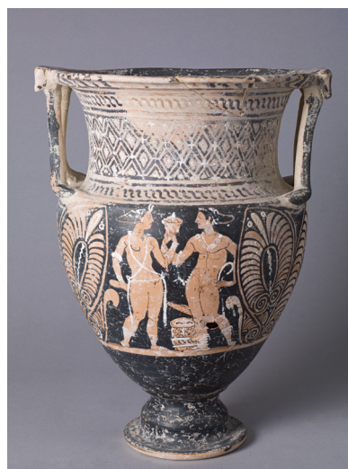
04. Cratère à colonnettes étrusque Céramique à figures rouges 320-280 av. J.-C. (vers) Nécropole d'Aleria-Casabianda - Tombe 53 Musée d'Aleria- MAA.2018.0.751

Pour toute autre utilisation, merci de contacter directement la Direction du Patrimoine/CdC.