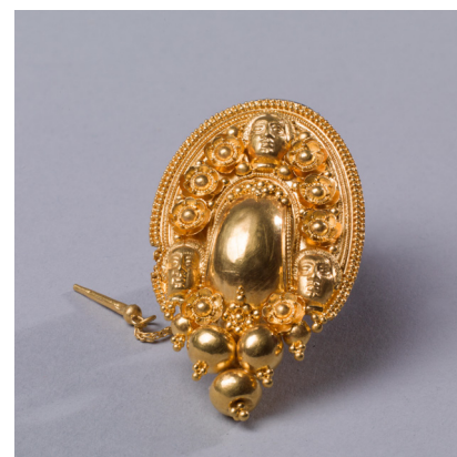
06. Boucle d'oreille « a grappolo » étrusque Tôle d'or 400 av. J.-C. (vers) Nécropole d'Aleria-Casabianda - Tombe 87 Musée d'Aleria- MAA.2018.0.4527