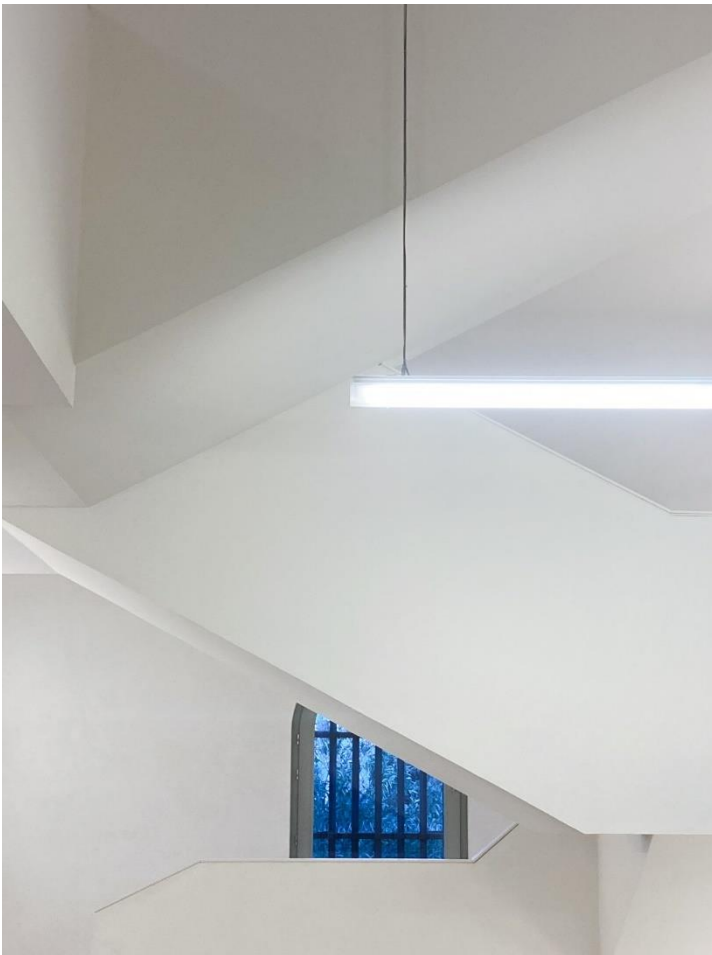
Figure 1.