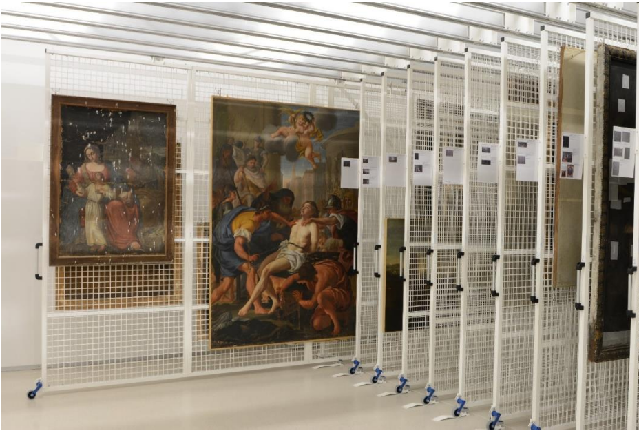
Figure 3.