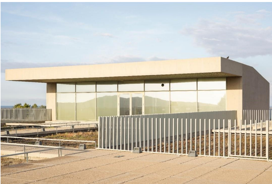
Figure 2.