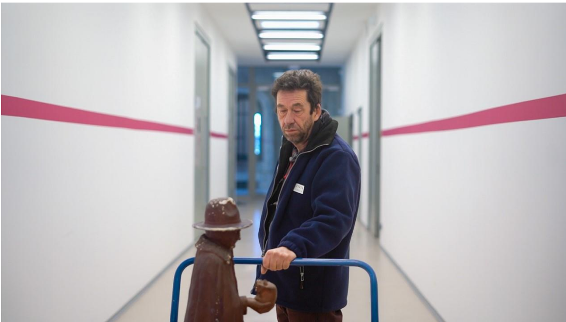
Images issues de la résidence de Florian Kiniques au CCRPMC