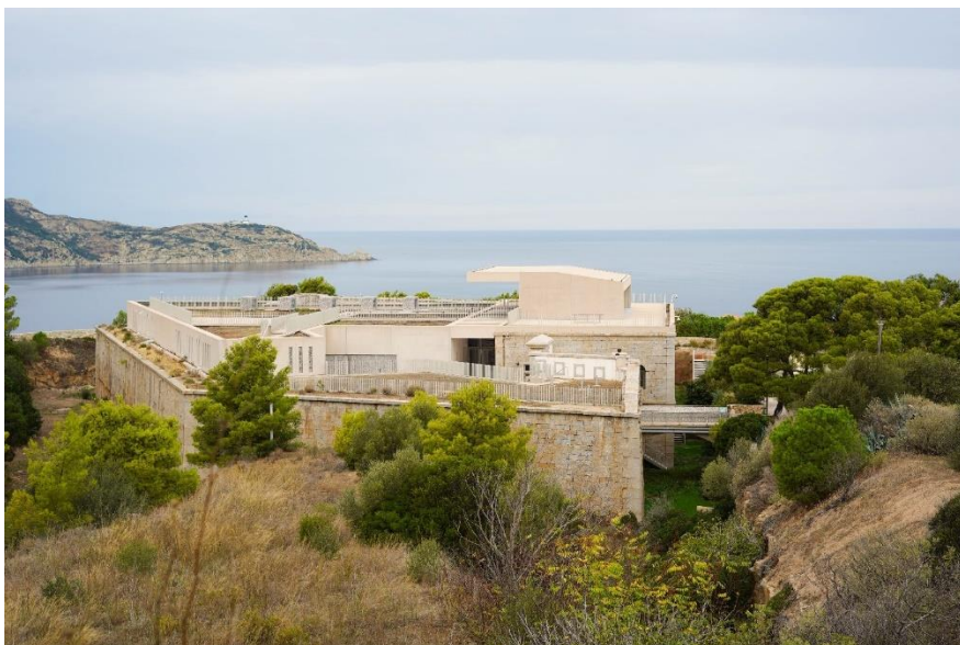
Figure 1.