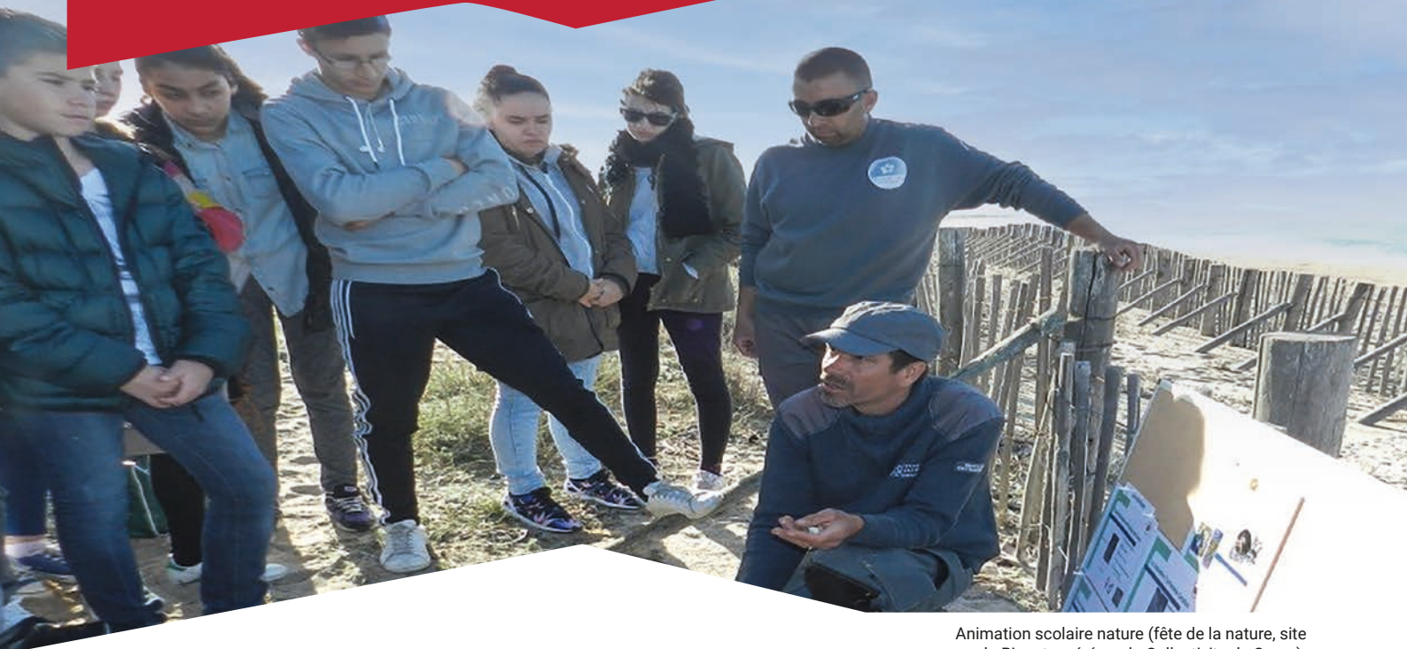
Animation scolaire nature (fête de la nature, site du Ricanto, géré par la Collectivité de Corse).

FAVORISER L'ÉPANOUISSEMENT DES ÊTRES HUMAINS