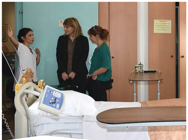
Visite des locaux de l'EHPAD de Toga et échanges avec les équipes et les résidents.

Pour favoriser le recrutement d'aides-soignants, des formations délocalisées sont programmées sur Sartène et Corte en septembre 2021. Une action qui s'inscrit dans un projet élaboré conjointement par la Collectivité de Corse, l'Agence régionale de santé, les Instituts de formation d'aides-soignants (IFAS), les hôpitaux territoriaux et le Comité de massif.