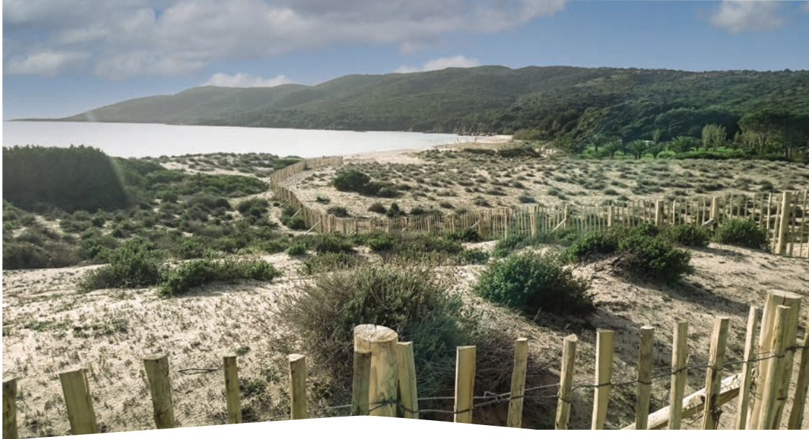
Site de Cupabia, Espace Naturel Sensible de la Collectivité de Corse.