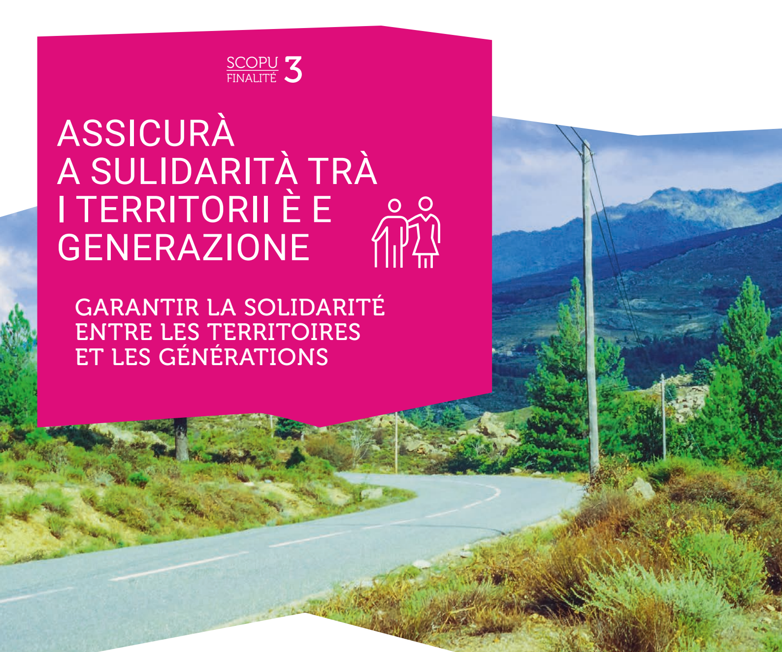
Route D84 près de Calacuccia.

GARANTIR LA SOLIDARITÉ ENTRE LES TERRITOIRES ET LES GÉNÉRATIONS