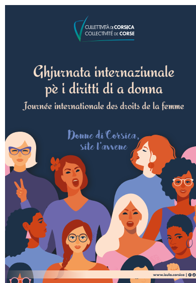
Evènement « Donne di Corsica, site l'avvene », 08 mars 2020, Bastia.

En 2021, une modification du règlement d'aides au logement « Una Casa per tutti, una casa per ognunu » sera proposée à l'issue de sa première année de mise en œuvre, afin d'en accroître la pertinence et l'efficacité. Une première version du portail d'accueil social sera mise à disposition du public courant du 1 er semestre 2021, avec l'objectif de couvrir dans l'année 100 % du territoire.