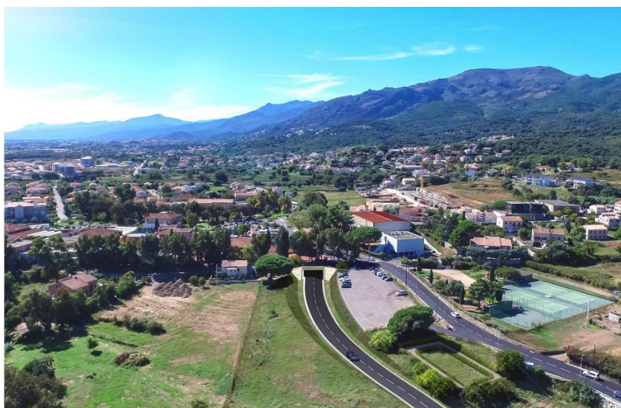
Vue aérienne de la RT12