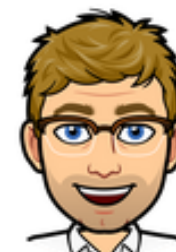
Alexandre VICANI Capiserviziuziu usi è servizii numerichi