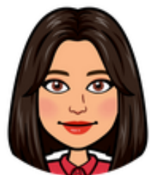
Estelle TROFFA Cunsigliera numerica Pumonti Recrutée en juin 2022