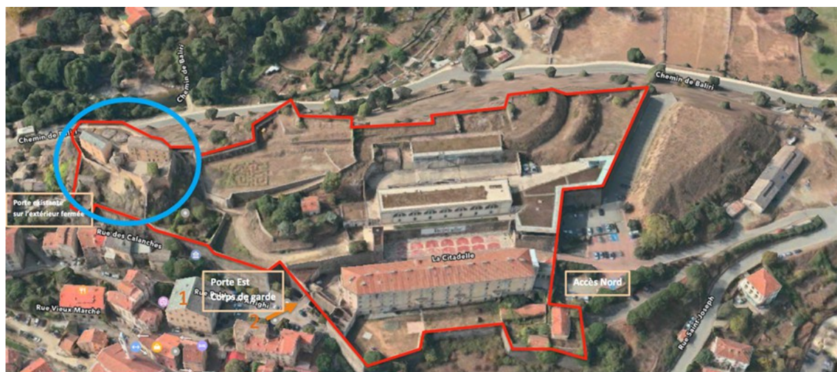
Le site de la Citadelle de Corti

La citadelle de Corti est toujours debout, solide et marque le territoire, les esprits et les cœurs. Grandiose dans son aspect et son ambition, elle est unique en France et en Europe.