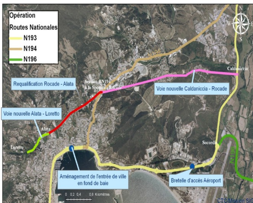
Projets d'aménagements d'Ajaccio par le schéma directeur des routes de Corse

Le projet de « Pénétrante » inscrit dans le schéma directeur est actuellement en phase d'études et a d'ores et déjà fait l'objet d'une enquête publique pendant laquelle la Collectivité de Corse s'est engagée à requalifier l'ex. RD 31 et l'ex. RT 22 (anciennement RN 194) , voie d'entrée/sortie de l'agglomération ajaccienne.