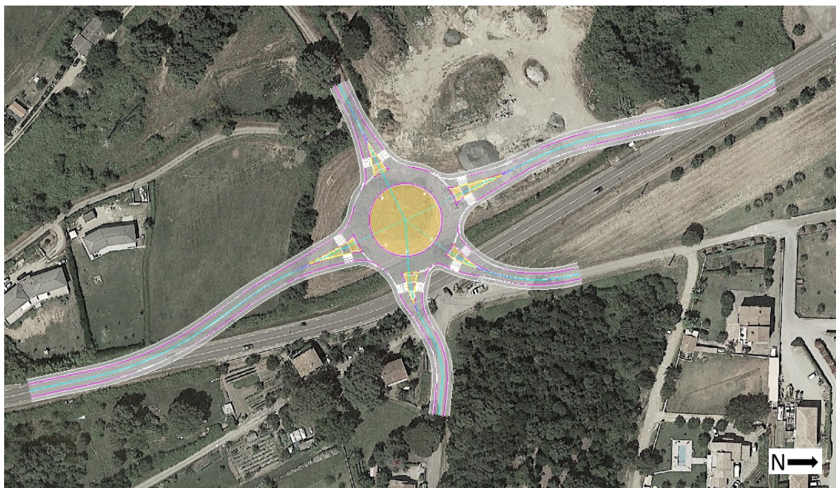
Aménagement projeté du carrefour de Rico Plage

La première estimation de cet aménagement, évaluée à 1 000 000 € TTC , sera affinée dans la suite de l'opération.