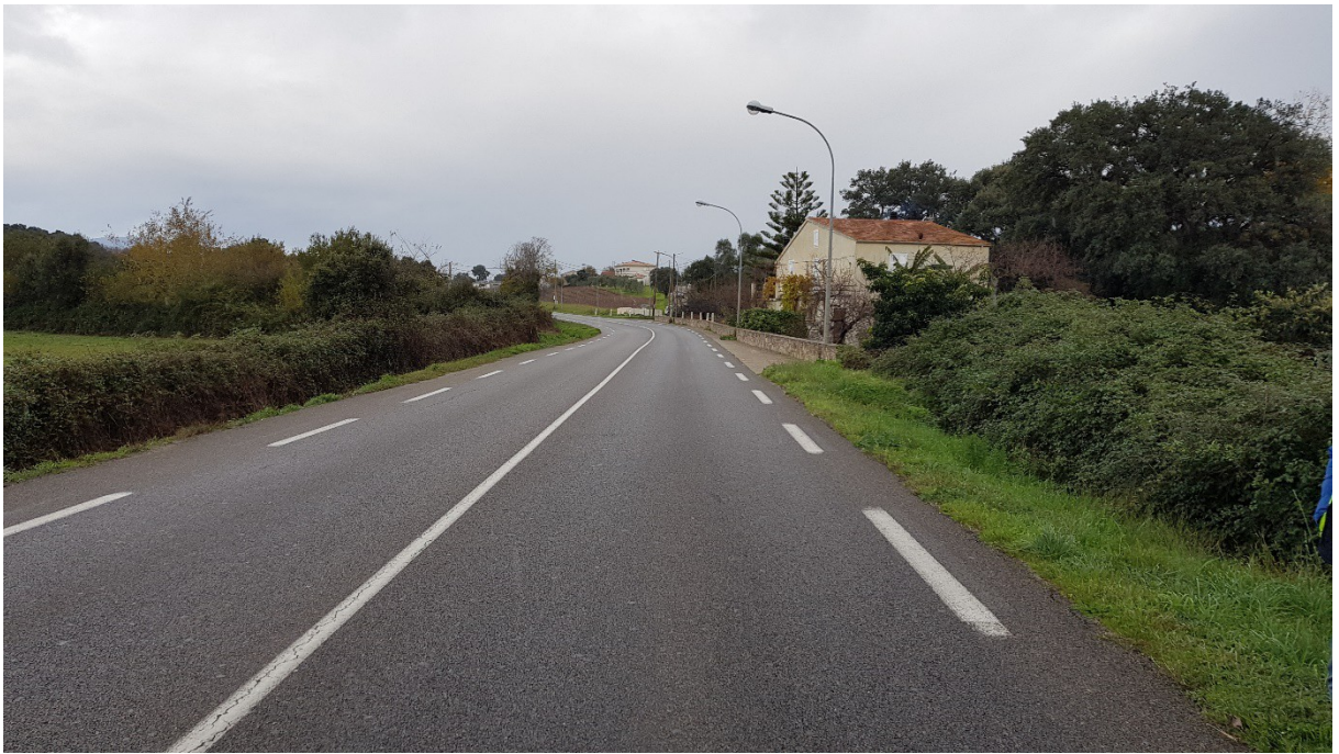
Vue en direction du nord du carrefour de « Rico Plage »

-Et 700 mètres plus au nord, en limite nord de la commune de Talasani avec la commune de Tagliu Isulacciu, le carrefour de la RD 30 qui débouche sur l'ex. RT 10 et qui draine le trafic d'une troisième zone urbanisée. La configuration du carrefour est dangereuse : l'ex. RD 30 débouche entre un cours d'eau et une habitation, et contre un ouvrage d'art avec des masques de visibilité qui empêchent les usagers d'avoir une vision correcte lorsqu'ils s'engagent sur l'ex. RT 10 aussi bien vers le Nord que vers le Sud.