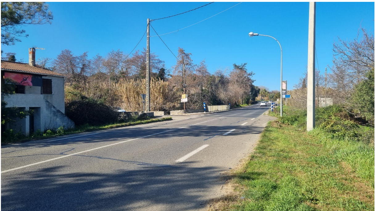
Vue en direction du nord du carrefour avec l'ex. RD 30

-Et 700 mètres plus au nord, en limite nord de la commune de Talasani avec la commune de Tagliu Isulacciu, le carrefour de la RD 30 qui débouche sur l'ex. RT 10 et qui draine le trafic d'une troisième zone urbanisée. La configuration du carrefour est dangereuse : l'ex. RD 30 débouche entre un cours d'eau et une habitation, et contre un ouvrage d'art avec des masques de visibilité qui empêchent les usagers d'avoir une vision correcte lorsqu'ils s'engagent sur l'ex. RT 10 aussi bien vers le Nord que vers le Sud.