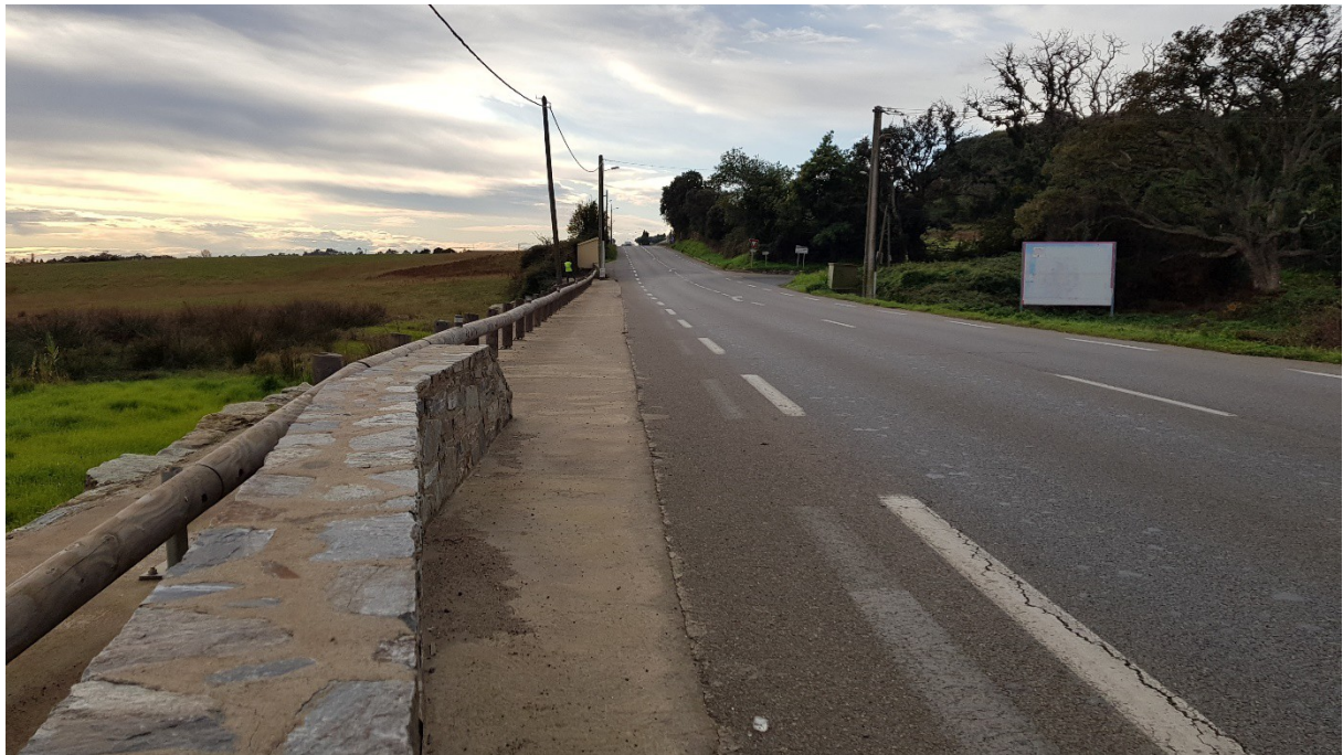
Vue vers le sud du carrefour de Valle Longhe

-Un premier carrefour dit « de Valle Longhe », avec une voie communale qui permet de desservir une zone urbanisée en plein développement. Ce carrefour qui n'est pas aménagé ; il comporte à proximité immédiate un arrêt pour le ramassage scolaire, au bord de l'ex. RT 10.