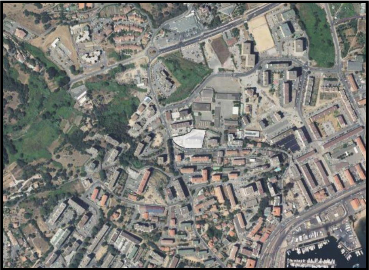
Figure 1: Vue satellite de la parcelle BO 389