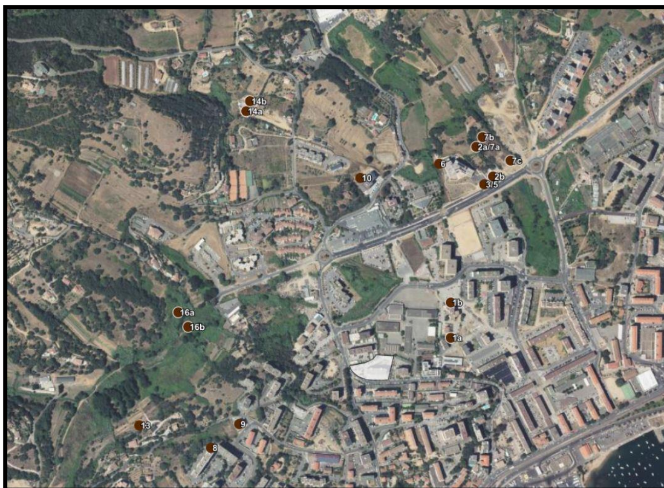
Figure 3: Extrait des ventes