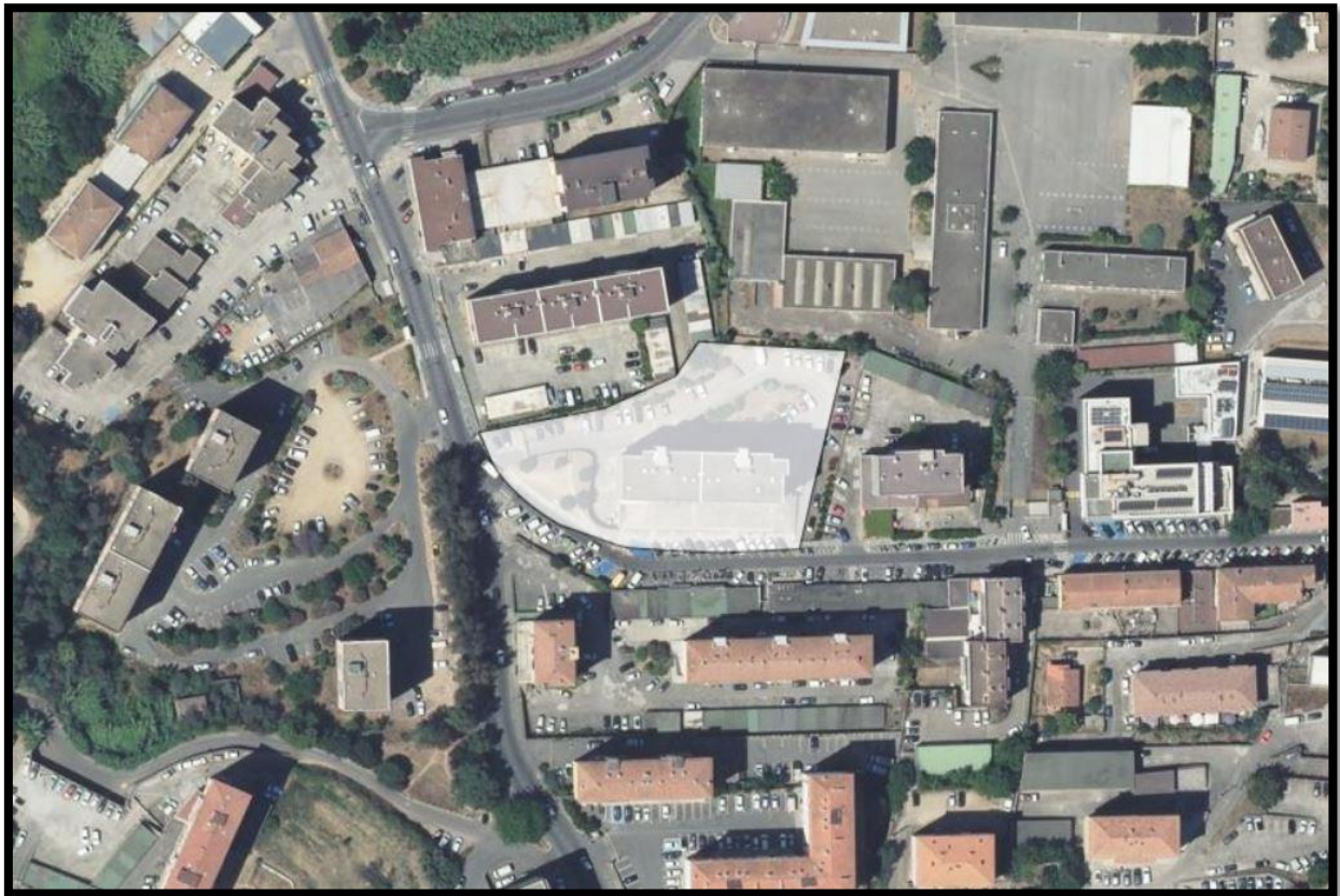
Figure 2: Vue satellite proche de la parcelle BO 389