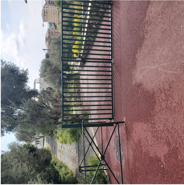
Photo de la résidence prise au début de la voie de passage bétonnée