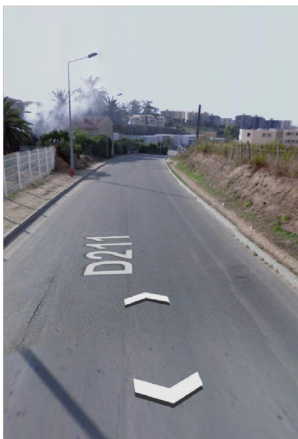
Figure 1. Ex. RD 211 Absence de trottoir