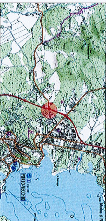
Plan de situation - sans échelle