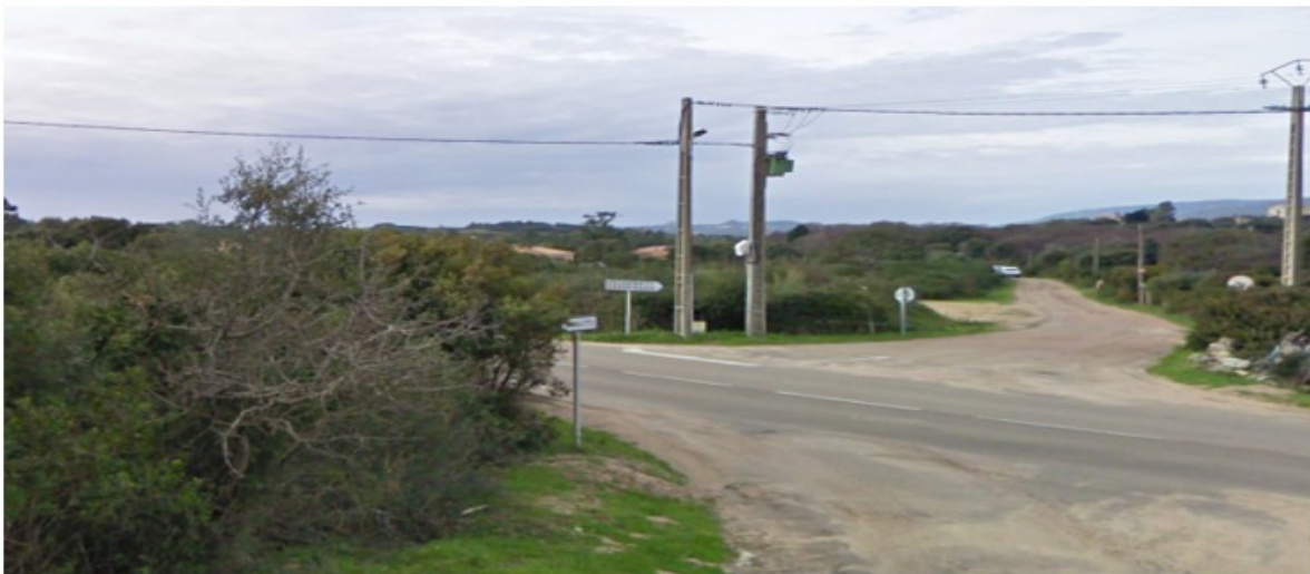
Visibilité réduite en sortie de la voie Fraulettu

Si plusieurs aménagements de carrefours et de traverses ont été réalisés ces dernières années, il semble aujourd'hui nécessaire de poursuivre la politique de sécurisation des carrefours sur cet itinéraire.