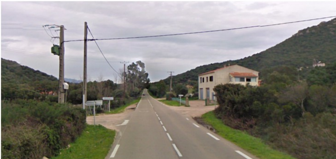
Visibilité du carrefour dans le sens Figari → Sotta

Si plusieurs aménagements de carrefours et de traverses ont été réalisés ces dernières années, il semble aujourd'hui nécessaire de poursuivre la politique de sécurisation des carrefours sur cet itinéraire.